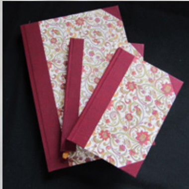
BI Sozialpsychiatrie e.V.